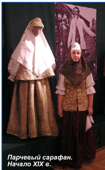
Парчевый сарафан. Начало XIX в.