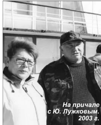
На причале с Ю. Лужковым. 2003 г.

Важным для дальнейшего развития музея стало утверждение концепции реставрации Преображенской церкви. Мы сумели убедить правительство Республики Карелия, министерство культуры России, что необходим комплексный подход к реставрации такого уникального памятника деревянной архитектуры. В результате на острове скоро завершится строительство закрытого реставрационного комплекса, грузового причала. Пршла заготовка леса, необходимо для будущих работ. Следующая задача — приобретение оборудования для нового реставрационного комплекса.