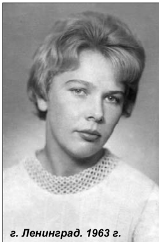
г. Ленинград. 1963 г.

За сорок лет в музее-заповеднике "Кижь" было восемь директоров. За каждым из них, независимо от срока работы, стоит музейная эпоха. Потому что все они — Личности. Труднее других — первому, так как приходилось все начинать, и тому, при котором подводятся итоги за определенный период работы музея. 40 лет — это своеобразный рубеж в жизни музея-заповедника. Перешагнув сорокалетие, он начнет приближаться к своему полувековому юбилею. И то, как будет дальше восприниматься музей будущим поколением, закладывается уже сегодня.