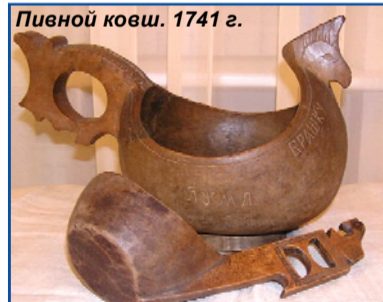
Пивной ковш. 1741 г.

На выставке представлено 130 подлинных фондовых предметов — особенно выделяется коллекция одежды. Женская и мужская, летняя и зимняя одежда, головные уборы — прекрасные свидетели жизни олончан на рубеже XVIII-XIX столетий. При сравнительно холодном климате приходилось уделять достаточное внимание одежде. О жизни и быте олонецкого населения, о воспитании детей, об их представлении о красоте можно судить по представленным на выставке детским игрушкам, женским украшениям, посуде.