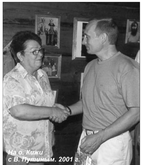
На о. Кижь с В. Путиным. 2001 г.

Хочу сказать также и о развитии экскурсионной деятельности музея. У нас очень хорошо отлажена работа по подготовке экскурсоводов. И хочется отметить, что, несмотря на все наши островные проблемы, сотрудники экскурсионного отдела слышат только слова благодарности.