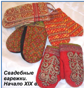
Свадебные варежки. Начало XIX в.

После этнографических экспедиций вышло множество научных публикаций о жизни русского населения Олонецкой губернии. Так, в 1903 г. у Н.И. Березина появляется такое описание: "Здесь русские большею частью среднего роста, сложены довольно пропорционально и стройны, черты лица правильные и часто красивые, особенно у женщин, сохранивших в некоторых местах славянский тип в большой чистоте; волосы русые или белокурые, а глаза чаще всего серые" ("Пешком к Карельским водопадам"). Подтверждение этих слов можно увидеть на фотодокументах РЭМа, которые также представлены на выставке.