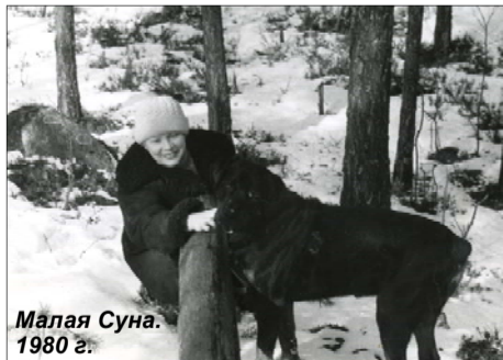
Малая Суна. 1980 г.

очень много гостей. Кто из них надолго остался в Вашей памяти?