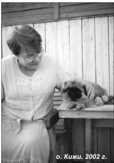
о. Кижь. 2002 г.