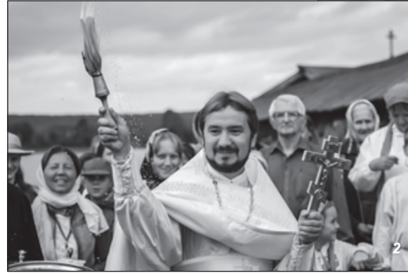
Фото: 1. Ж. Гвоздева. «Задорная кадрили». 2. Д. Новицкий. «Весёлый батюшка». 3. В. Синявина. «Дом Рябиных, Кижь, 1936 год».