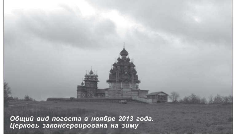
Общий вид погоста в ноябре 2013 года. Церковь законсервирована на зиму

Все желающие могут познакомиться с фотоотчетом по адресу: http://kizhi.karelia.ru/gallery/unesco_transfiguration_2013