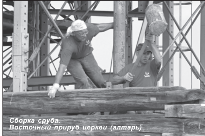
Сборка сруба. Восточный прируб церкви (алтарь)

На сайте музея-заповедника «Кижь» в разделе «Кижская галерея» опубликован очередной фотоотчет о процессе реставрации Преображенской церкви, иллюстрирующий работы, проведенные в 2013 году. Фотоотчет включает более 50-ти фотографий, авторами которых являются сотрудники музея Борис Москвин и Олег Семенов.