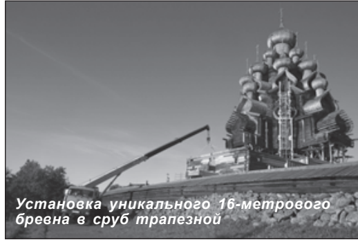
Установка уникального 16-метрового бревна в сруб трапезной