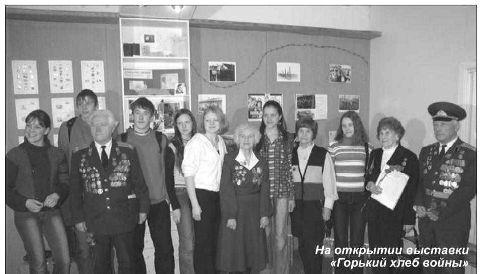
На открытии выставки «Горький хлеб войны»

Выставка рассказывает об эвакуации, оккупации и даже депортации в Сибирь «ненадежных элементов» — такова суровая правда жизни. Организаторы выставки старались показать объективную историческую картину тех лет.