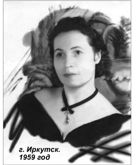
г. Иркутск. 1959 год

Один француз высокого роста пытался примериться к кро-