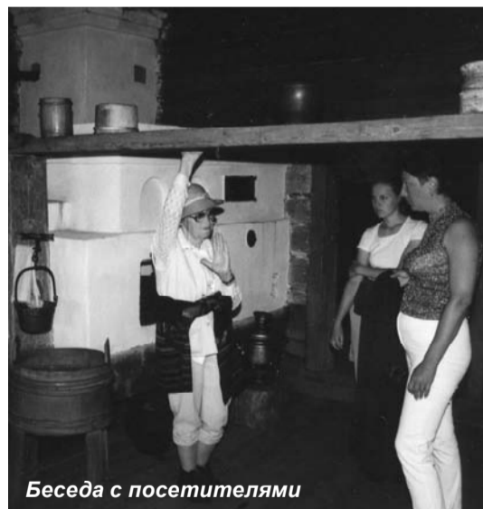
Беседа с посетителями