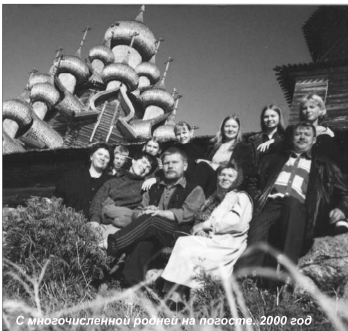
С многочисленной родней на погосте. 2000 год