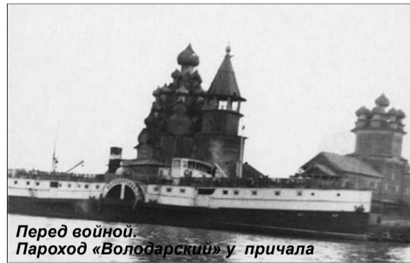
Перед войной. Пароход «Володарский» у причала

С нетерпением ждали теплого лета. На одном участке, у барака №9, охранная зона близко подходила к густому кустарнику ольхи, по соседству с бывшим клубом «Строитель». Кро-