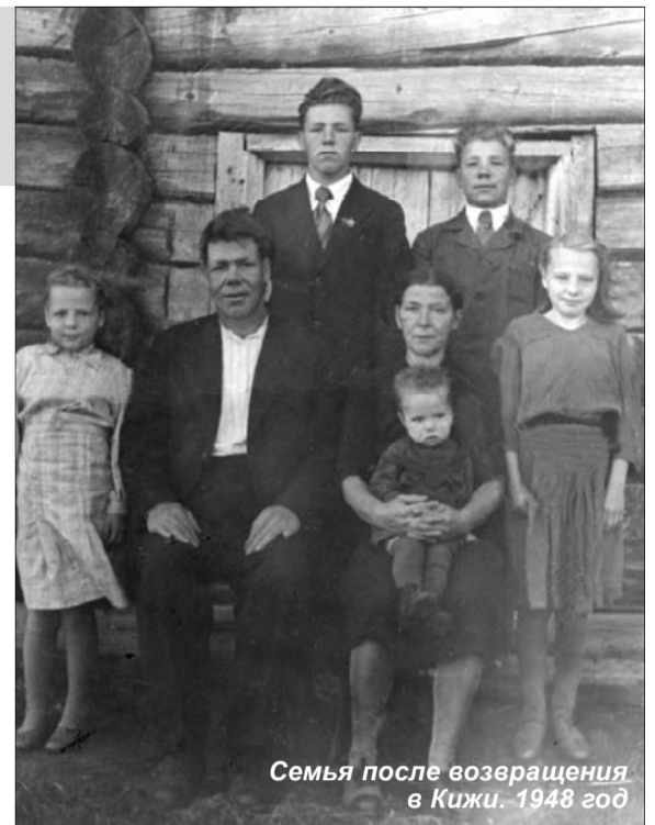
Семья после возвращения в Кижы. 1948 год

Самыми впечатляющими моментами тех далеких дней были два последних дня пребывания в концлагере. 27 и 28 июня 1944 года финская армия отступала, и ее солдаты сплошным пото-