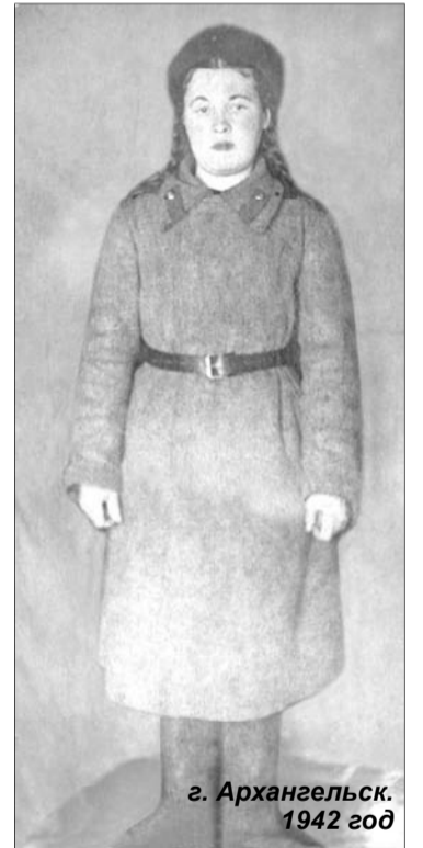
г. Архангельск. 1942 год

— Я всегда была не в ладах с тремя вещами: чтобы все успеть, мне не хватает времени, сна и, как, наверное, большинству пожилых людей сегодня, — денег. Но нельзя об этом постоянно