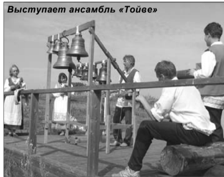
Выступает ансамбль «Тойве»

«Кижы», собственно и связано возвращение на остров колокольных звонов. Сегодня он звонит в соборе Александра Невского и обучает мастерству молодых ребят.