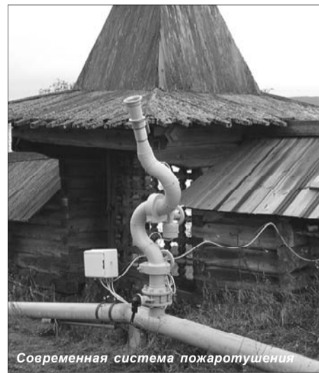
Современная система пожаротушения

Трудно оценить значение работы карельских специалистов по ликвидации последствий аварии Чернобыльской АЭС. Кижские установки спасли не одну жизнь ликвидатора.