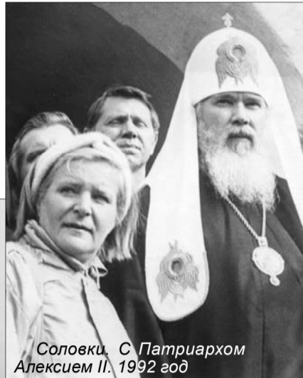
Соловки. С Патриархом Алексием II. 1992 год

что не смогу дальше участвовать в формировании этого музея. И я вернулась на остров. Я так и не смогла приспособиться к материковой безбрежности суеты. Возможно, этим объясняется мои недолгие материковые «зигзаги» судьбы.