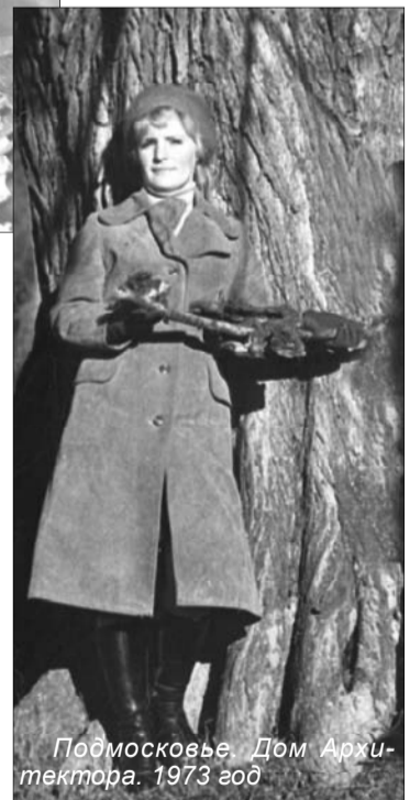
Подмосковье. Дом Архитектора. 1973 год