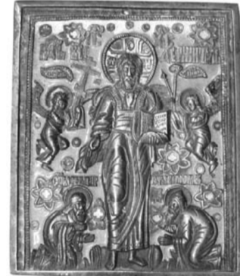
Икона. «Спас Всемилостивый»

— Да вот были тут ленинградские туристы. Уж так упрашивали меня отдать, так упрашивали, что я не могла им отказать.