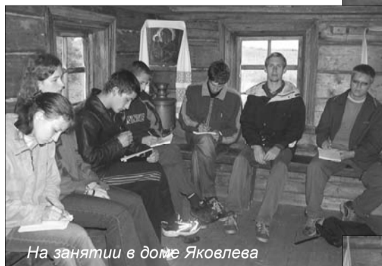
На занятии в доме Яковлева

Цель программы — познакомить будущих специалистов с деятельностью музея, преподать основы музееведения. Предварительное анкетирование показало, что студенты имели весьма неясные представления о музейных профессиях и деятельности музея в целом. Программа сессии