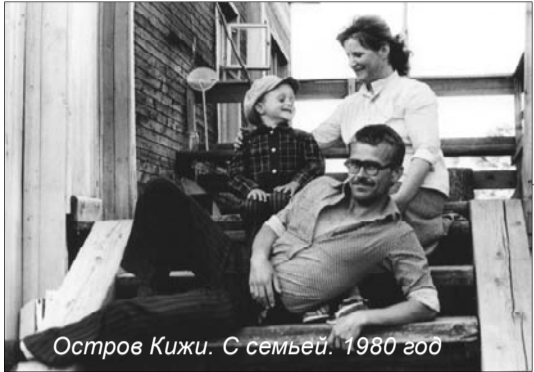
Остров КижИ. С семьей. 1980 год

Удивительными по эмоциональному воздействию и сплочению вокруг музея не только музейщиков были ярмарки ремесел.