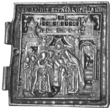
Створка складня. «Введение в церковь пресвятой Богородицы»

Но даже в первые годы собирательства не было передо мной какой-то ясной цели. Чаще всего этот процесс проходил спонтанно во время моих поездок с литературными выступлениями или журналистскими заданиями. Приведу только несколько примеров.