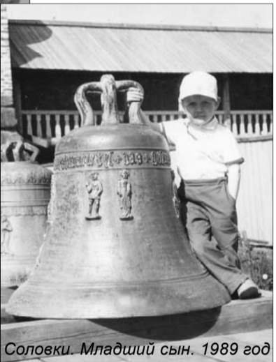
Соловки. Младший сын. 1989 год

Отступлений от "островной" линии судьбы было несколько. Кроме "Малых Карел" были краеведческий музей, Державинский лицей, создание Республи-