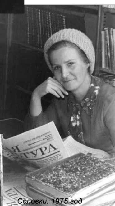
Соловки. 1975 год