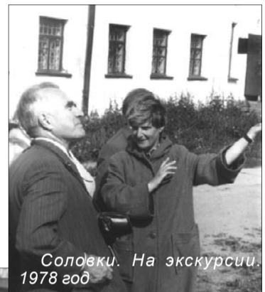
Соловки. На экскурсии. 1978 год

Но местное население в те годы завоевывалось очень непросто. И мы, пять человек, разработали 65 тем лекций, и пошли с ними в народ. Волекали население — а тогда на острове жило 900 человек — во Всероссийское общество