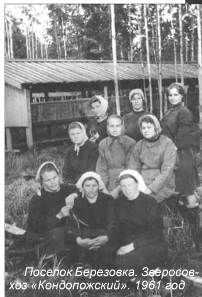
Поселок Березовка, Заеросовхоз «Кондопожский». 1961 год

писывали ленинградские ученые, которые бывали в Великой Губе в 50-х годах прошлого века. Эта же бабушка окрестила свою шестилетнюю внучку Лягу в церкви Великой Губы, пока не было отца дома. Отец практически всю жизнь был на партийно-хозяйственной работе. Когда он, 18-летний встретил юную учительницу из Ленинградской области, то ежедневно ходил по 14 километров из Шуньги в деревню Узкие, чтобы с ней уви-