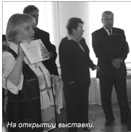
На открытии выставки.

Эти строки русского поэта Виктора Старкова будто писались под впечатлением от выставки "Преображение", которая открылась в начале сентября в выставочном зале музея-заповедника "Кижы". Главное действующее "лицо" экспозиции — Преображенская церковь в Кижях, которой в этом году исполнилось 290 лет. Ее макет, расположенный в центре зала, в округлой полупрозрачной форме олицетворяет многофункциональную роль церкви, ее многогранность. Это центральный образ, вокруг которого задумана экспозиция. Творение рук человеческих, размещенное в круге — символ вечности, задает определенный настрой для восприятия выставки. Симво-