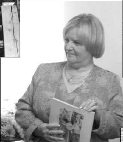
Музей «КижИ». 2004 год