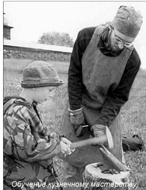
Обучение кузнечному мастерству

предоставляет им жилье, условия для занятий, питание и — главное — возможность включить природную среду острова, уникальный памятный и интеллектуальный потенциал музея в образовательный процесс. То историко-культурное и природное наследие, которое музей хранит, изучает и представляет обществу, тогда станет личным достоянием ребенка, когда у него будет возможность это наследие воспринять, прочувствовать, пережить. По мысли философа В. Франкла, "...ценностям нельзя научиться, их нужно пережить". Музей — в этом смысле — действительно служит "душеобразовательно" (мысль другого философа, Н. Федорова).