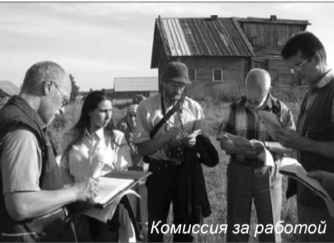
Комиссия за работой

А если загородный дом разрешено строить на территории музея-заповедника "Кижь" (а это около 10 тыс. га, включая остров Кижь, близлежащие острова и прибрежную зону материка), то все требования должны соблюдаться особенно строго. За этим следят многие ведомства, но часто работают они независимо друг от друга. Вот почему музей выступил с инициативой объединить их усилия. По мнению музейных специалистов по строительству, архитектурным и природным ландшафтам, только совместная работа сможет выявить проблемы и нарушения в застройке на территории музея и, самое главное, помочь владельцам домов их решить.