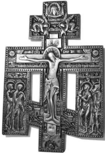
Крест киотный. Распятие с предстоящими

в зимние сани. Я пошутил, что продолжаю профессию отца. Но я собираю предания, живое народное слово... Теперь решил собрать еще две коллекции — медных литых иконок и колокольчиков. Так разговор перешел на предметы, которые висели на виду в переднем углу и слегка отличались светом потускневшей меди. Одним словом, из дома Мошниковых я увез колокольчик с надписью по нижне-