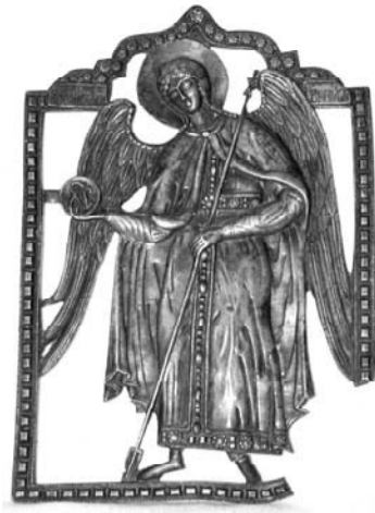
Икона. «Архангел Гавриил»

В один из дней в моем гостем. Выяснилось, что она помнила моего отца — заготовителя пушнины и кожсырья, разъезжавшего по деревням района на казенной лошадке, запряженной то в телегу, то