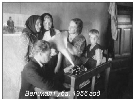
Великая Губа. 1956 год