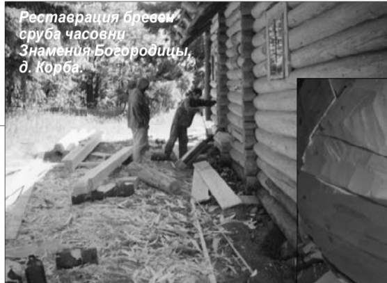
Реставрация бревен сруба часовни Знамения Богородицы, д. Корба