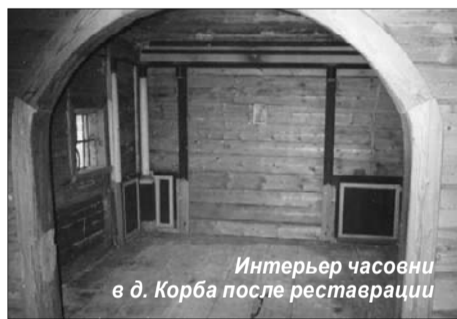
Интерьер часовни в д. Корба после реставрации