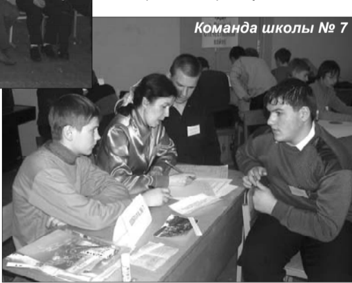
Команда школы № 7

тие реликвии говорит об исключительности представленных предметов, характеризующих быт и особенности военного времени: письма-треугольнички, пробитые осколками солдатские котелки, продуктовые карточки блокадного Ленинграда, патефон, кук-