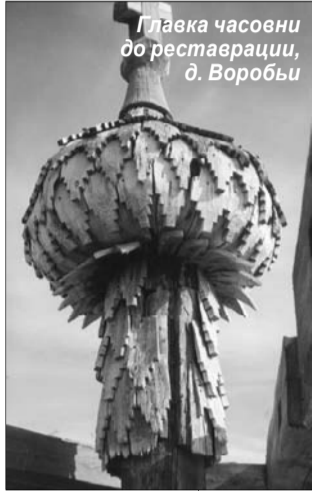
Глава часовни до реставрации, д. Воробы

Одной из основных задач музея является проведение ремонтно-реставрационных работ на кровлях памятников архитектуры, так как основная нагрузка на строение от атмосферных осадков приходится именно на кровлю.