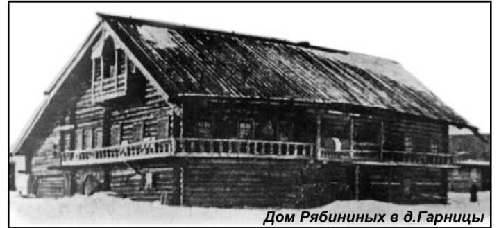
Дом Рябининых в д.Гарницы

Эвакуировались, до Киж доехали, напротив Зубовых самолет налетел и стал бомбить нас, нашу баржу-то. А пароход взял да отцепил, бросил баржу эту, ушел. Вот, баржа качается — ходит, тут меж деревнями. Ну, вот, значит, у меня ребят шестеро, у меня веревки нету, все