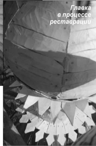
Глава в процессе реставрации