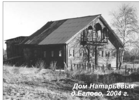
Дом Натарева д.Еглово, 2004 г.

Необходимо отметить, что за последние несколько десятилетий после возведения в 30-х годах XX века на реке Свирь двух плотин произошел подъем уровня воды в Онежском озере, что изменило береговую линию всех прибрежных деревень и места всех старых бань, части амбаров и луг перед часовней залиты водой.