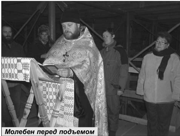
Молебен перед подъемом

О том, что только «хирургическое вмешательство» способно вернуть Преображенскую церковь, специалисты говорили давно. Проекты реставрации с завидной скоростью и частотой сменяли друг друга. Среди них были и запредельные. Например, залить церковь бетоном, используя существующее строение как деревянную опалубку.