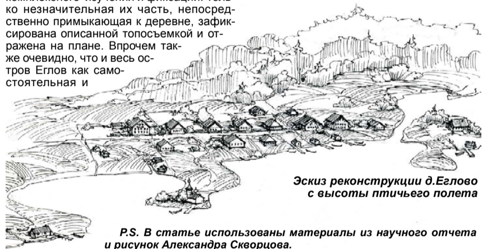
Эскиз реконструкции д.Еглово с высоты птичьего полета