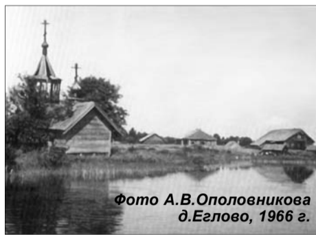
д.Еглово, 1966 г.

В 2004 году началась работа по натурному обследованию д. Еглово, на основе которой с учетом информации, предвари-