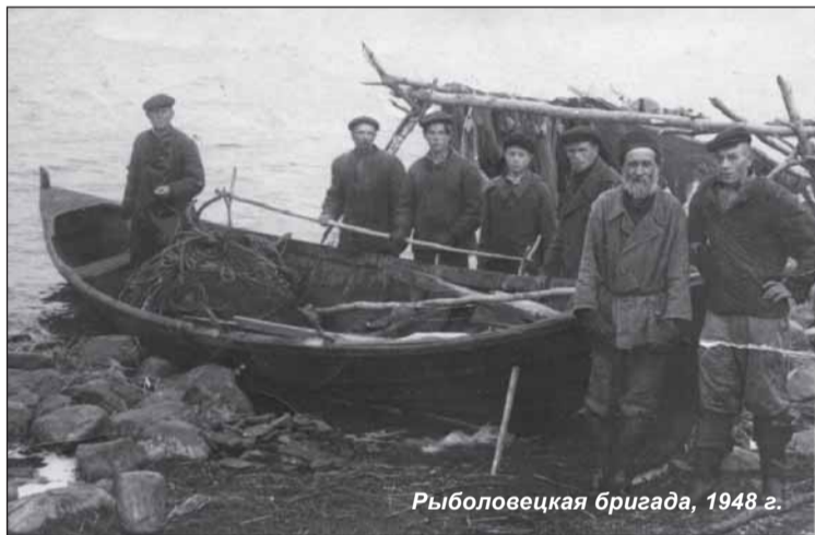
Рыболовецкая бригада, 1948 г.

Закон о пятилетнем плане восстановления и развития народного хозяйства К-ФССР на 1946—1950 гг. предписывал превысить довоенный объем сельскохозяйственной продукции на 70 процентов. Между тем как объем централизованных капитальных работ по сельскому хозяйству