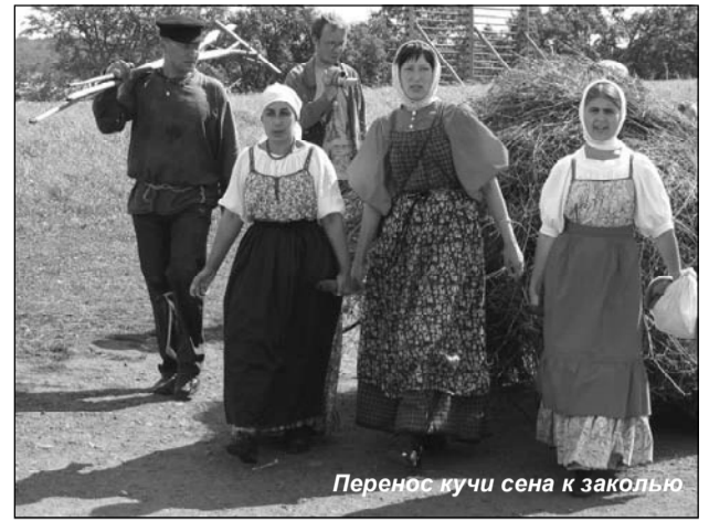
Перенос кучи сена к заколью

Ну а огородные дела шли своим чередом: два раза окучили картошку, по мере надобности пололи, рыхлили, поливали всё на пользу растущее. В заключение хочется по-