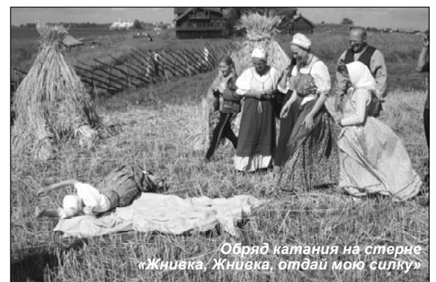
Обряд катания на стерне «Жнивка, Жнивка, отдай мою силку»

Ну а потом вскипел самовар и пошёл пир горой, на выкошенной меже, под ясным солнышком, с отжинными песнями. Подходили и подходили группы экскурсантов, стояли рядком, замороженно слушали «Раздывью», «Экого Ваню». Прошло всё действие живо и непринуждённо, и пели не по заказу, по долгу службы, а от души, с куражом. Можно сказать, что работать с такими воодушевлёнными людьми — настоящее счастье. Спасибо всем.