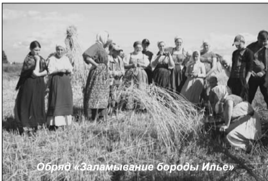
Обряд «Заламывание бороды Илье»

«Отжином» в Заонежье называли трудовой праздник окончания жнитвы (жатвы), то есть всё! — жать закончили, отжали. Праздник-то он, конечно, праздник, но всё же трудовой, то есть это не праздное гуляние и езда по гостям, а дожинные полоски, исполнение необходимых обрядов и только после всего — праздничное застолье, но не «стихийное» разгульное, а с доброй усталостью, с сознанием завершённой страды и, опять же, с традиционными обрядовыми кушаньями.