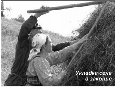
Укладка сена в заколье

Все понимают, насколько важен в «музее быта», а музей-заповедник «Кижы» это музей традиционного крестьянского быта в широком смысле — не только быта внутридомового, но и усадебного, и деревенского, и волостного, насколько важен «эффект присутствия». Помню из детства пресловутую горящую ленинскую зелёную лампу, открытый «Капитал» Маркса и очки на столе. Как будто Ильич только что вышел... Эффект этот, конечно, важен и вне идеологии — он оживляет предметный ряд экспозиции, даёт тёплое дыхание давно покинутым хозяевами стенам музейных домов.