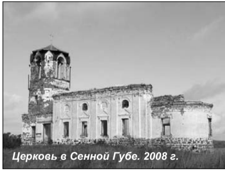
Церковь в Сенной Губе. 2008 г.