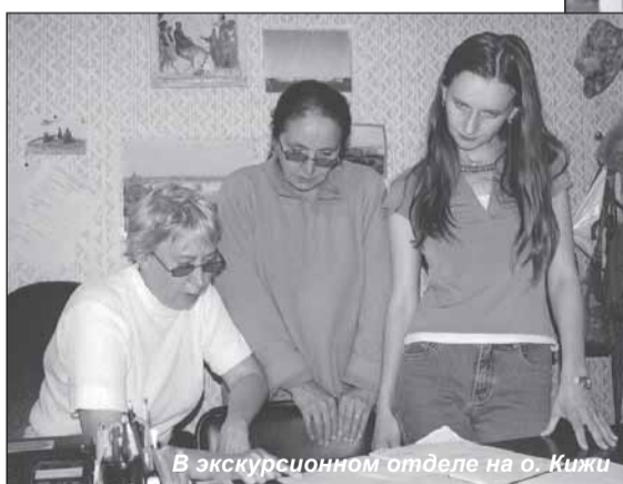
В экскурсионном отделе на о. Кижь

И сейчас самые близкие мои друзья работают в музее — это Лена и Юра Наумовы, с которыми я знакома с детства и юности».