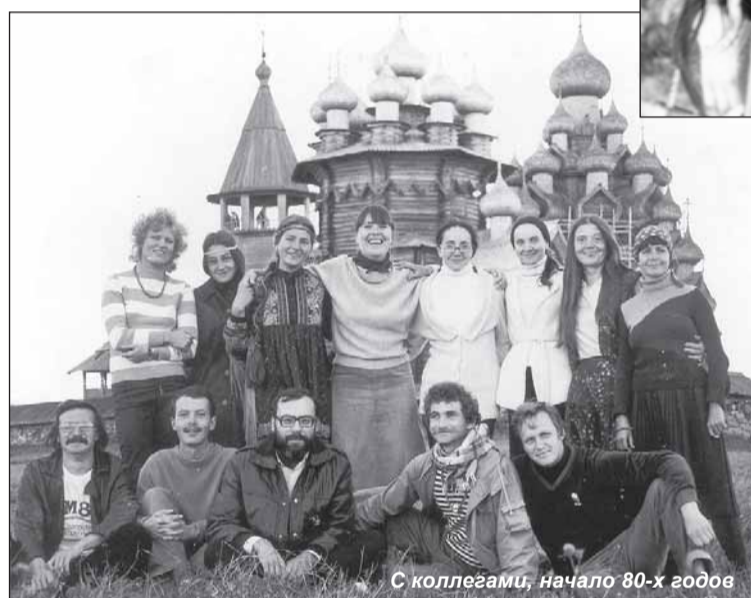
С коллегами, начало 80-х годов