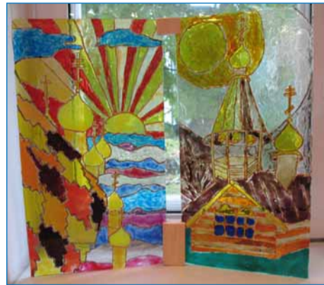
«Сампо», сделанные студийцами, а также заглянуть в «Чудесный шкаф», хранящий в себе всякие разные загадки.