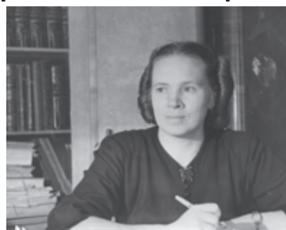
«Кижы» №10 (72), стр.7